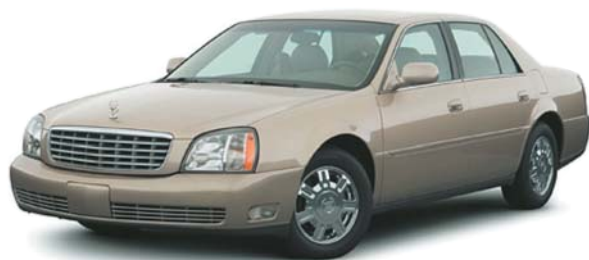
キャデラック ドゥビル