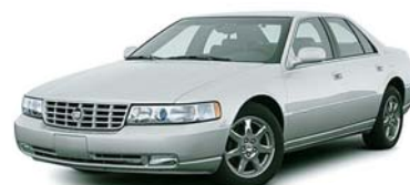
キャデラック セビル