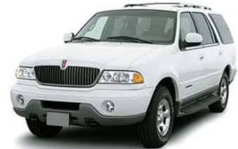
リンカーン ナビゲーター