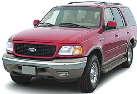
フォード エクスペディション