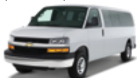
シボレー エクスプレス