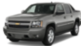
シボレー アバランチ