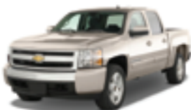
シボレー シルバード (CKシリーズ)