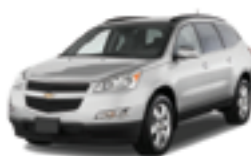
シボレー トラバース